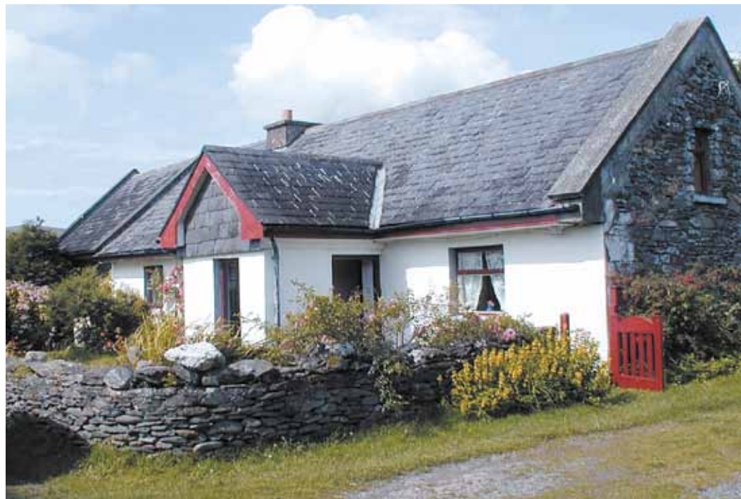
Peirienhaus imleach Slat 1